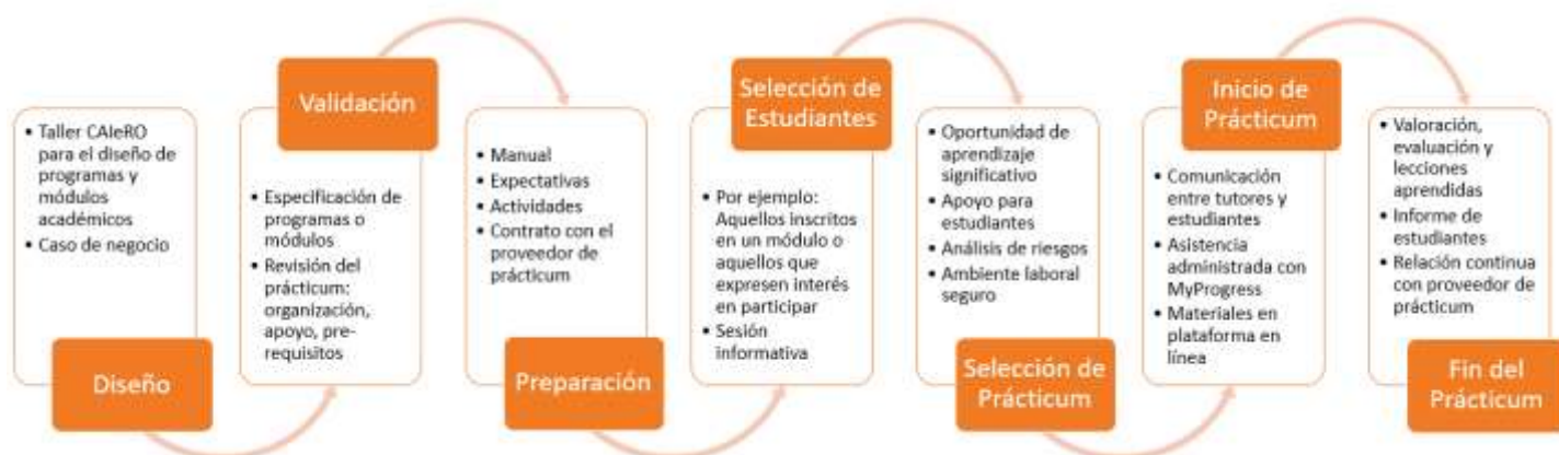
Figura 2. Proceso de implementación de prácticum en la Universidad de Northampton